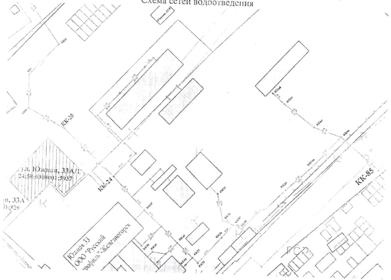
Схема сетей водоотведения