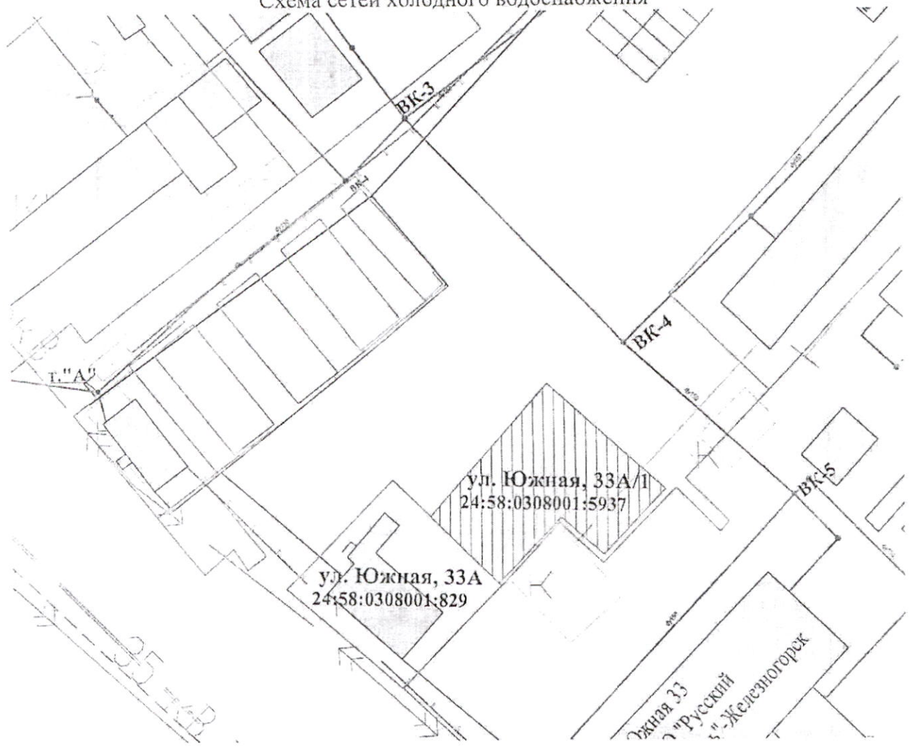
Схема сетей холодного водоснабжения